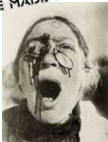
Eisenstein 'Potemkin' 1925

“THROUGH CLEVER AND CONSTANT APPLICATION OF PROPAGANDA, PEOPLE CAN BE MADE TO SEE PARADISE AS HELL, AND ALSO THE OTHER WAY AROUND” ADOLF HITLER