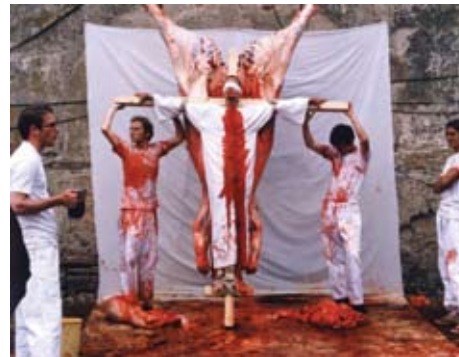
right Hermann Nitsch Performance Art 'Theatre of Orgies and Mysteries Prinzendorf' 1984 above 'Theatre of Orgies and Mysteries Salzburg' 1990

Bunlar, gerçeği çarpık bir şekilde yaymak için medyanın nasıl kullanılabileceğiyle ilgili hemen akla gelen birkaç örnekti. Şimdi ise özgül bir dünyada yaşıyoruz ve bildiğimiz kadarıyla da devlet çıkışlı sansür ya da kontrol mevcut değil. Buna dayanarak da Adolf'un yapmış olduğu bazı tavsiyelere yeniden bakalım. Kalabalıkları ikna etmek için onların seviyesinde propagandalar kullanılmalıdır. Bu propagandalar basit, kolay anlaşılır olmalı ve zekaya değil duygulara hitab etmelidir. Karşımızdaki kitle ne kadar büyük olursa, entellektüel düzeyi de o kadar düşük olacaktır ve bu noktada uygulanacak olan propaganda da gerçeği nesnel bir şekilde yansıtmaya amaçlı gütmek yerine belli başlı noktaları tekrar tekrar yinelemeyi